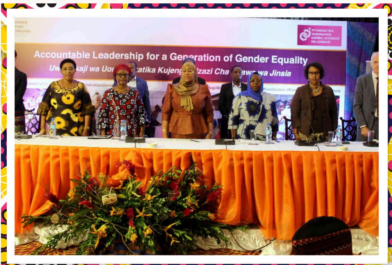
Picha: Moja ya mikutano na Mhe. Samia Suluhu Hassan, Rais wa Jamhuri ya Muungano wa Tanzania iliyogusa Uwajibikaji wa Uongozi kujenga Kizazi cha Usawa na Jinsia.

Kwetu sisi Wanamtandao wa wanawake Katiba, Uongozi na Uchaguzi imetudhibitia kwamba, katiba na hasa katiba yenye mrengo wa jinsia, ikiwa ni sheria mama, inaweza kutumika kujenga nguzo imara kwenye kuwezesha mabadiliko chanya kwenye harakati za utetezi wa madai ya haki nzetu. Fursa hii itaendelea kutupa chachu ya kuendeleza madai ya kuwepo na mabadiliko ya katiba yenye mrengo wa jinsia.