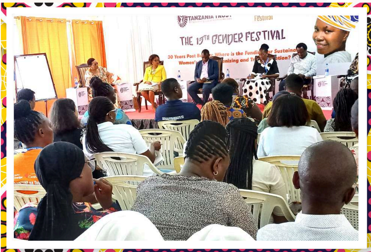
Picha: Moja ya matamasha ya Jinsia yanayochochea uongozi wa wanawake, usawa wa Jinsia na upingaji wa ukatili

Mwisho na siyo kwa daraja, Mtandao umejenga utamaduni wa kutafakari kwa kina, kujifunza na hata kusherekea mafanikio yetu. Mfano Tamasha la Jinsia la Tanzania lilioongozwa na TGNP liliweza kuleta pamoja wakilishi zaidi ya elfu mbili toka sehemu zote za nchi yetu. Vile vile sherehe za miaka 15 za Mfuko wa Ufadhili uliweza kuleta zaidi ya washiriki --- ambao kwa muda wa siku chache, walisherekea, walitafakari safari yetu na hatimaye kupendekeza maeneo ya kuimarisha.