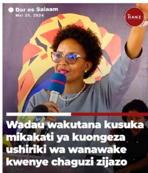
Picha: Baadhi ya wanamtandao wakizungumza na wanahabari kuhusu mapendekezo ya mtandao kwenye sheria za uchaguzi