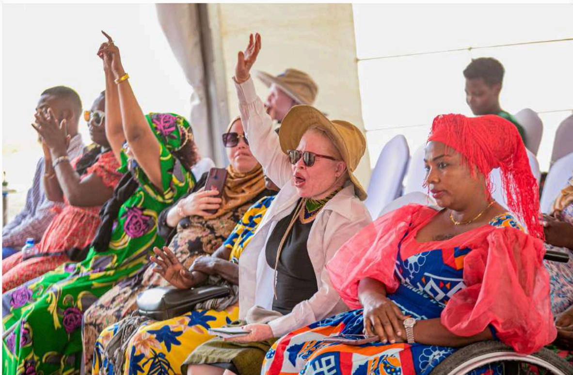
Picha: Kundi la watu wenye mahitaji maalumu wakishiriki kwenye moja ya makongamano ya Mtandao

Katiba hii ni lazima iweke bayana makubaliano ya muafaka wa kitaifa yatakayopewa ridhaa na wanawake na wanaume kwa pamoja. Kwamba, katiba mpya sharti ijengewa misingi ya usawa, utu na inayokataza aina zozote za ubaguzi na unyanyasaji wa kijinsia. Ni katiba itakayobatilisha sheria zote zinazokinzana na misingi ya haki na usawa wa jinsia. Hivyo katiba iwajibishe serikali kuhakikisha raia wote, wanawake na wanaume wanapata haki sawa na zinalindwa, na kuna vyombo vya kusimamia ulinzi wa haki hizo.