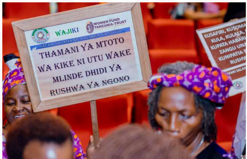
Picha: Moja ya mikutano na wanahabari kuhusu Rushwa ya Ngono