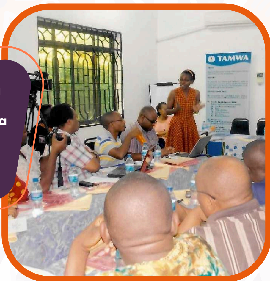
Picha: Moja ya mikutano na vyombo vya habari kuhamasisha umuhimu wa katiba yenye mrengo wa jinsia