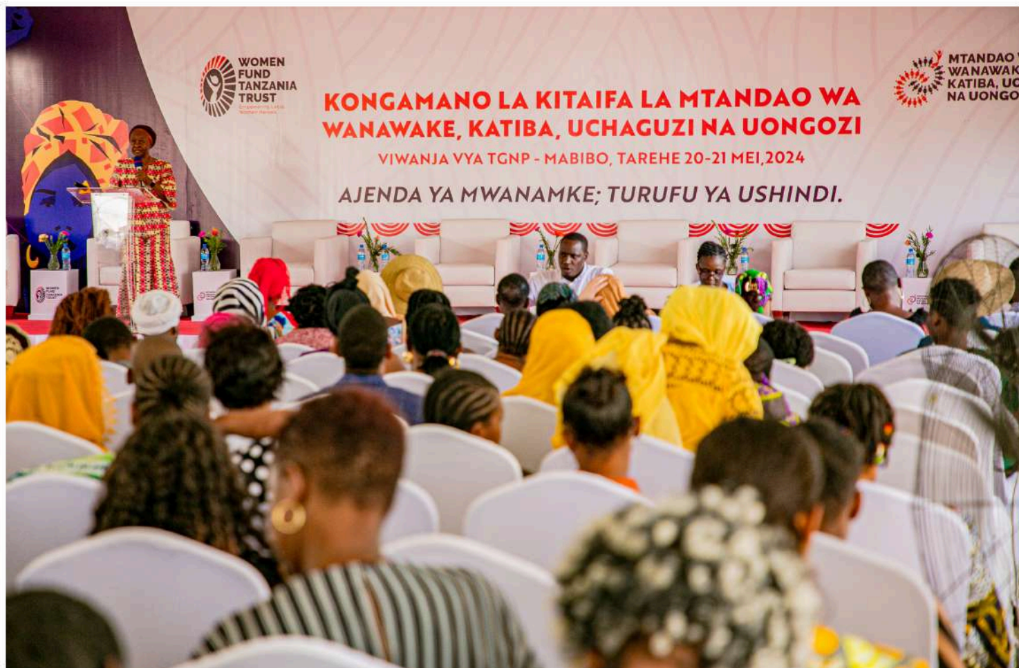
Picha: Washiriki wa Kongamano la Kitaifa la Wanawake wakifuatilia mada kuhusu safari ya Mtandao huo

Kujengeana uwezo ili kuwa na uelewa wa mukadha, fursa zilizozoko na changamoto zake. Mbinu zilizotumika ni pamoja na mafunzo, mijadala ya rika, kongamano na mikutano, pamoja na utafutaji wa rasilimali kwa kutumia fursa iliyojitokeza kwa kuwepo kwa Mfuko wa Ufadhili wa Wanawake Tanzania